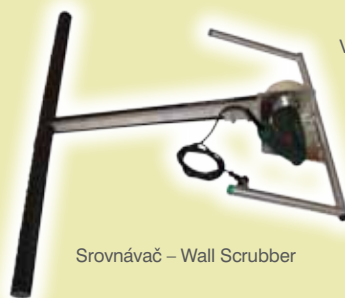
Srovnávač – Wall Scrubber