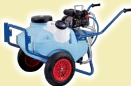
Тележка с баком 130 л+ насос